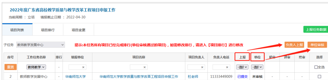
图 7 单位审核