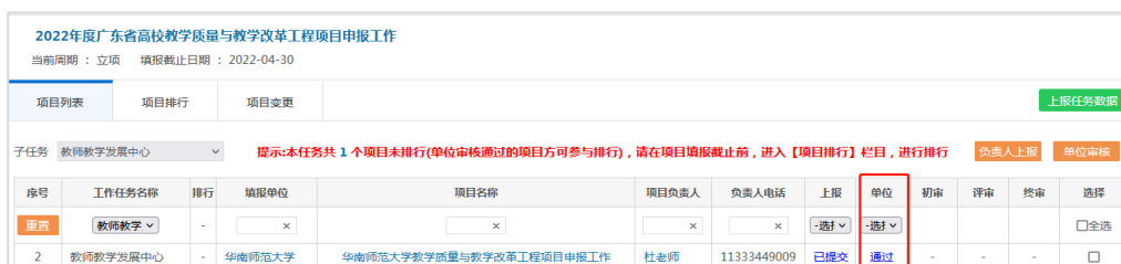
图 9 完成审核

在二级单位负责人完成对所有项目的审核工作后，一项完整的项目填报工作已经结束。如下图所示。